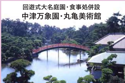
回遊式大名庭園・食事処併設 中津万象園・丸亀美術館 丸亀市中津町25-1 TEL 0877-23-6326