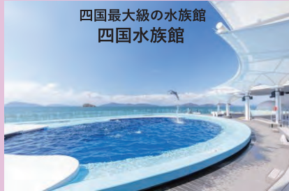
四国最大級の水族館 四国水族館 綾歌郡宇多津町浜一番丁4 TEL 0877-49-4590