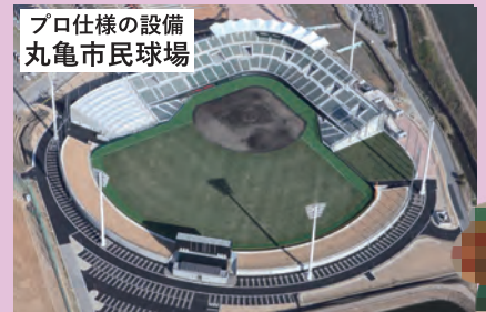
プロ仕様の設備 丸亀市民球場 丸亀市金倉町975番地 TEL 0877-35-8200